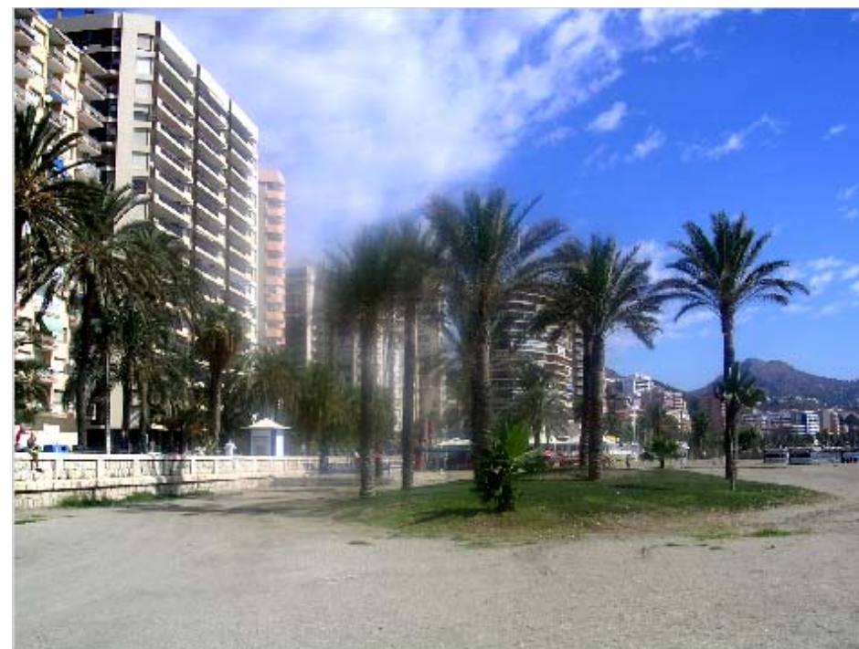
SITUACIÓN DE LA CALICATA (consultar plano)