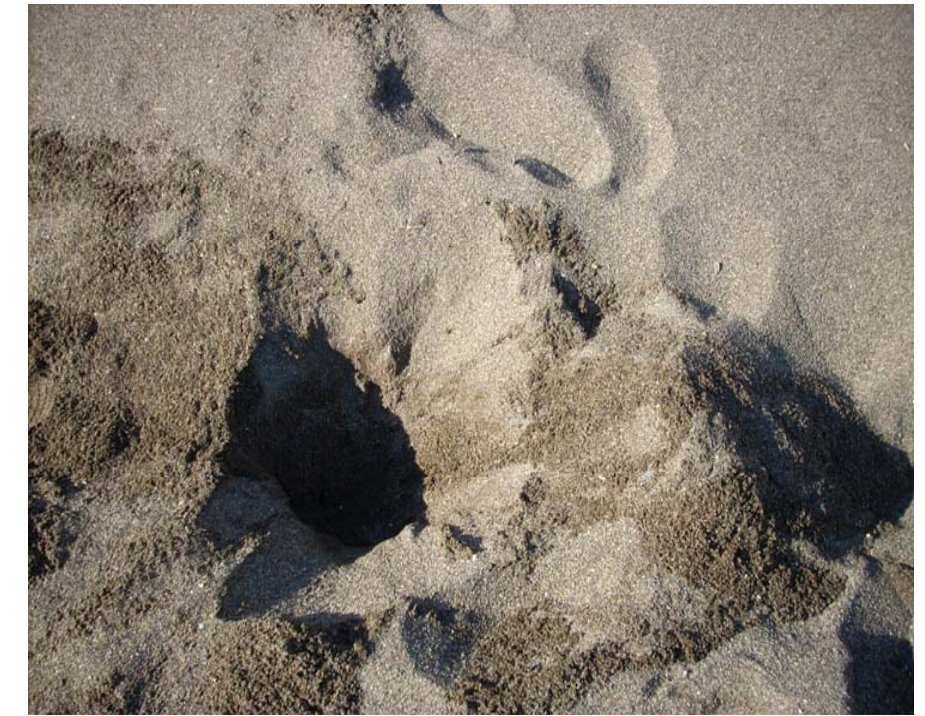
FOTOGRAFÍA Nº 1. Aspecto general de la calicata

Ambiente Paleogeográfico: COSTERO Unidad Morfológica: PLAYA